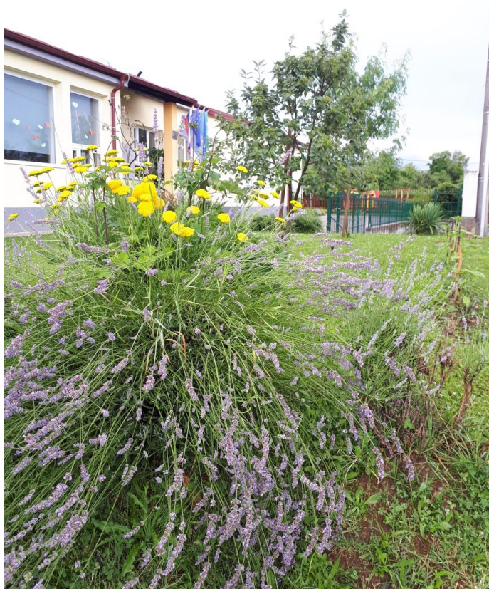
Sprednja stran šole.

Letni delovni načrt Osnovne šole Jelšane je zasnovan v skladu z 31. členom Zakona o osnovni šoli (Uradni list RS, št. 81/06 – uradno prečiščeno besedilo, 102/07, 107/10, 87/11, 40/12 – ZUJF, 63/13 in 46/16 – ZOFVI-K) in zajema vsebino, obseg in razporeditev vzgojno-izobraževalnega in drugega dela v skladu s predmetnikom in učnim načrtom ter obseg, vsebino in razporeditev interesnih in drugih dejavnosti, ki jih izvaja šola.